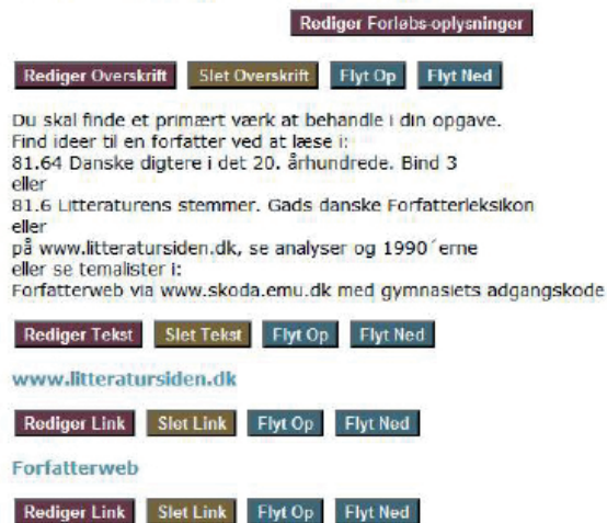
Figur 2. Skærmbillede af redigering af undervisningsforløb i prototypen www.lib-guide.dk